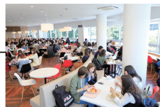
▲ASIA PLAZA 2F フリースペース Free Space in ASIA PLAZA 2F