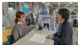
▲8号館国際ショナルセンター International Center