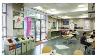
▲8号館 国際交流ラウンジ International Lounge