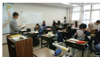
▲8号館 留学生別科の教室 Class: Intensive Japanese Course